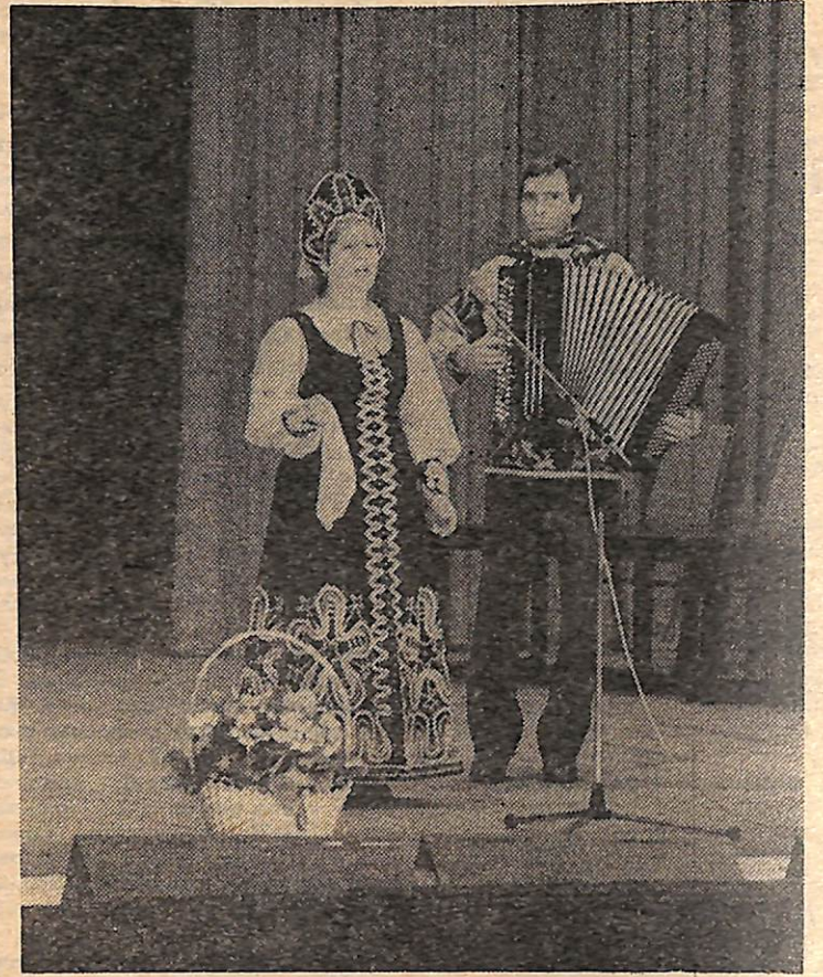
присвоению ему звания народного