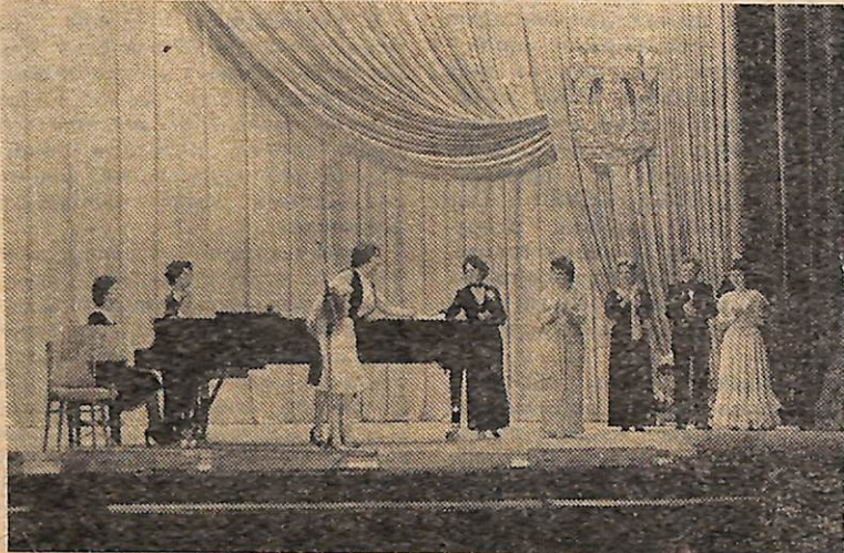
На снимках: концерт вокального коллектива, посвященный

Итоги Всесоюзного смотра будут в апреле-мае 1985 года в районных центрах и городах в рамках юбилейных мероприятий. Лучшие коллективы и исполнители смогут принять участие в праздновании 40-летия Победы в областных центрах, столицах союзных республик.